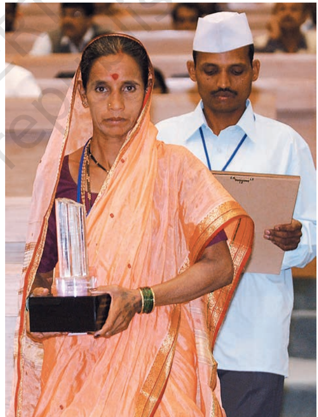
महाराष्ट्र के दो पंच, जिन्हें 2005 में अपनी पंचायत में उल्लेखनीय काम करने के लिए 'निर्मल ग्राम पुरस्कार' से सम्मानित किया गया।

ग्राम पंचायत की नियमित रूप से बैठक होती है। उसका मुख्य काम उसके क्षेत्र में आने वाले गाँवों में विकास कार्यक्रम लागू करवाना होता है। जैसा कि आपने देखा ग्राम सभा ही पंचायत के काम को स्वीकृति देती है तभी पंचायत अपना काम कर पाती है।