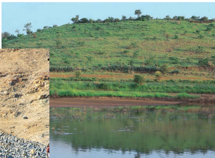
जल संवर्धन विकास कार्यक्रम ने केवल दो वर्षों में इस बंजर ज़मीन को हरे-भरे मैदान में बदल दिया है

पंचायती राज व्यवस्था एक ऐसी प्रक्रिया है जिसके द्वारा लोग अपनी सरकार में भाग लेते हैं। ग्रामीण क्षेत्रों में ग्राम पंचायत लोकतांत्रिक सरकार का पहला स्तर है। ग्राम पंचायत ग्राम सभा के प्रति जवाबदेह होती है क्योंकि ग्राम सभा के लोग ही उसको चुनते हैं।